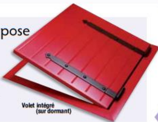
Volet intégré (sur dormant)