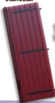
Volet à lames verticales ou horizontales